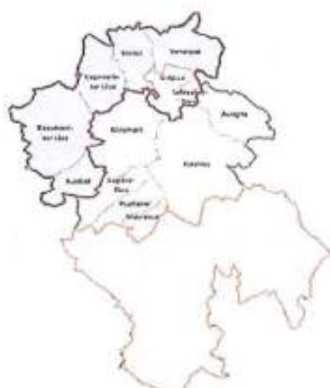
Proposition de découpage avec des zones de services pour la population ; réalisé en temps de trajet.