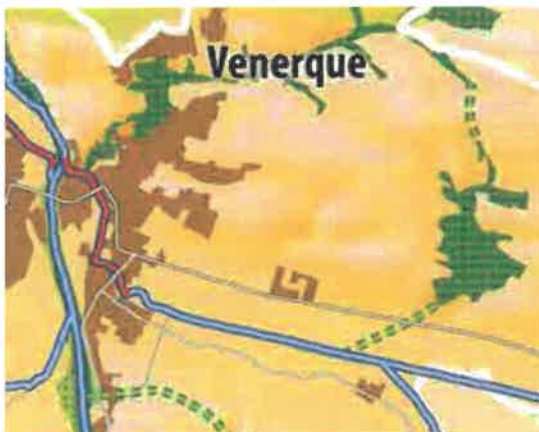
Trame verte et bleue du SCoT en vigueur 2012

Le projet répond aux objectifs du DOO concernant la préservation et valorisation du territoire pour les générations futures au regard de la protection des réservoirs et des corridors écologiques. Le PLU projette de protéger les composantes actuelles de la trame verte et bleue ainsi que de poursuivre la valorisation de la qualité environnementale et paysagère (maîtrise de l'urbanisation, gestion spécifique des eaux pluviales, dispositions spécifiques sur les clôtures en limites de zones agricoles et naturelles, etc).